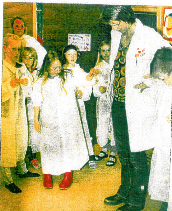
TEST. Til slutt ble spretten i alle ballene i testet og gitt godkjent.