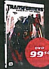
Transformers 3 (1 salg 7/12)