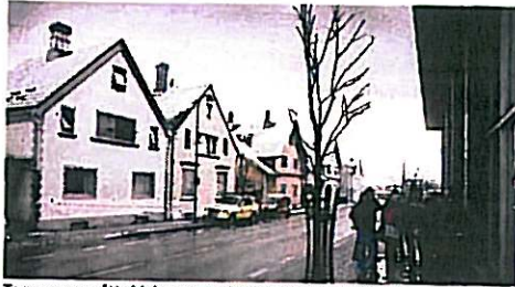
To personer måtte hjelpes ut, og flere naboer ble evakuert.

TOR DAGFINN DOMMERSNES td.dommersnes@aftenbladet.no