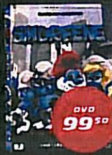
Smurfene (1 salg 7/12)