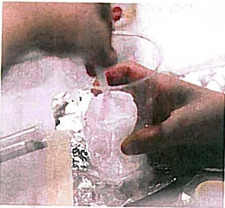
Hudkrem til mamma, mormor, farmor - eller til den som måtte trenge det mest.