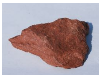
Sandstein Sedimentær (lagdelt) bergart