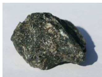
Larvikitt (uslepet) Sedimentær (lagdelt) bergart