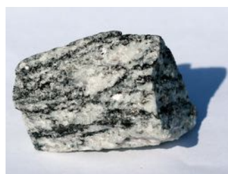
Gneis Metamorf (omdannet) bergart