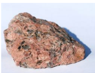
Granitt Magmatisk (størknings-) bergart