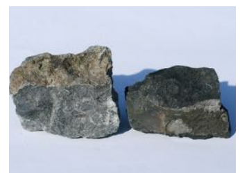
Kalkstein m/fossil Sedimentær (lagdelt) bergart